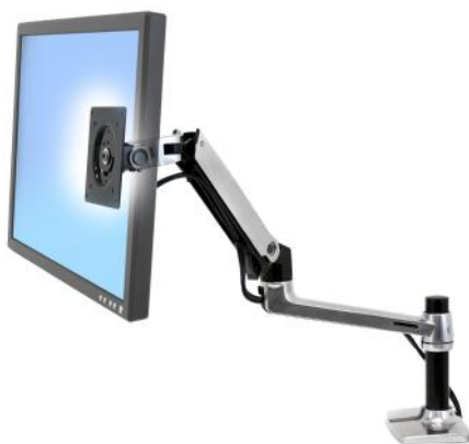
Litteän näytön varsi TC503