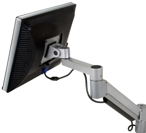
Litteän näytön varsi TC500

Jousellinen kaksinivelinen varsi. Asetat vaivattomasti näytön juuri oikealle korkeudelle teitpä työtä istuen tai seisten. Vakiona useita erilaisia kiinnitysvaihtoehtoja.